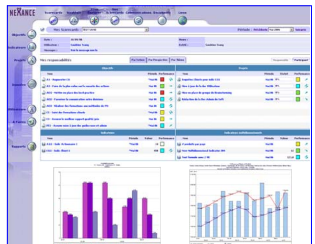
Grâce à l'écran My Scorecard, visualisez l'ensemble des éléments stratégiques pour lesquels vous êtes responsable ou contributeur