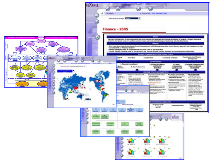
Construisez le modèle stratégique qui vous convient le mieux