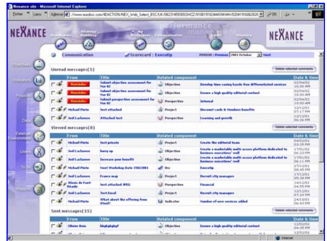
Au travers de l'écran Communication, accédez à l'ensemble des commentaires et messages liés aux éléments stratégiques